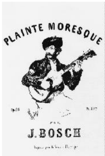
Jaume Bosch dibuixat per Édouard Manet